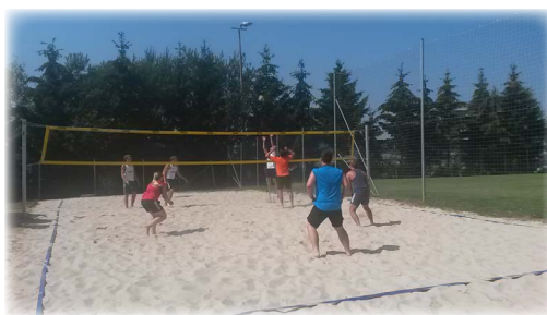
Die Gemeinde lädt zum Spiel am Beachvolleyballplatz auf der Union ein.

Die Gemeinde dankt für das vielfältige qualitätsvolle Angebot!