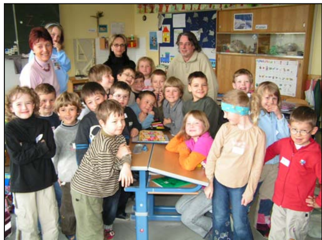
Die Katsdorfer Volksschüler freuen sich über die neuen höhenverstellbaren Tische, die von der Gemeinde angeschafft wurden.