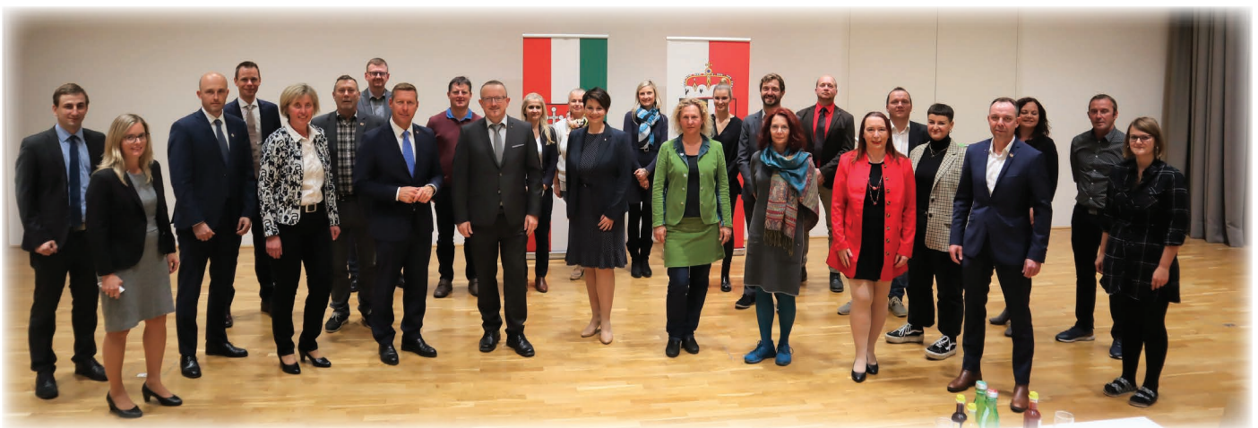
Angelobter Gemeinderat für die Periode 2021 - 2027