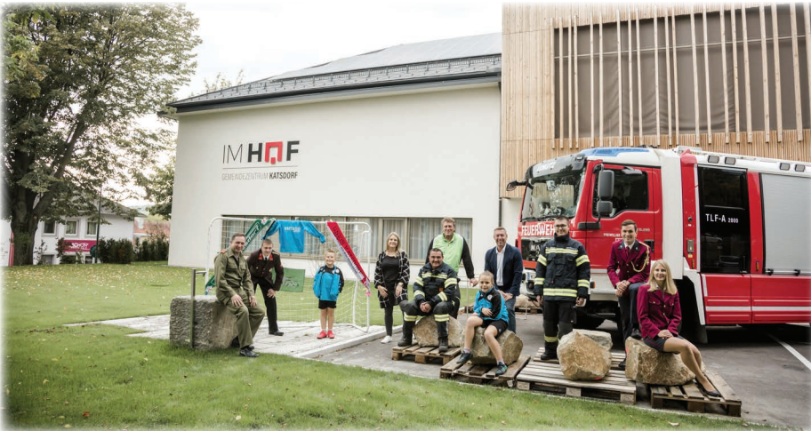
Das Team des Katsdorfer Hofballs freut sich auf Ihren Besuch!

Erstmals in der Geschichte Katsdorfs organisieren die drei Feuerwehren Lungitz, Ruhstetten und Katsdorf, die zwei Sportvereine Askö und Union sowie der Musikverein einen gemeinsamen Ball.