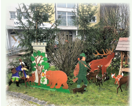
Märchenwald am Dorfplatz