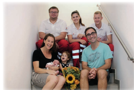
Geburt mit Katsdorfer Sanis