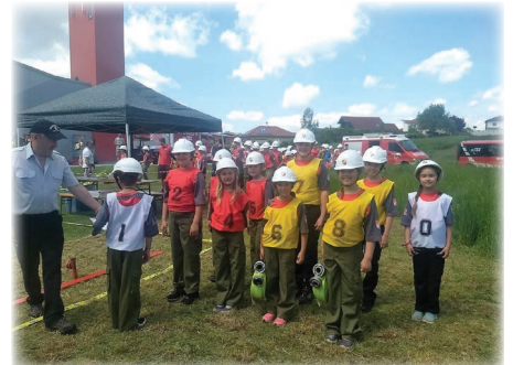
Die Jugendgruppe beim Abschnittsbewerb in Ried in der Riedmark.

Am 20. Mai fand der jährliche Frühjahrsputz im Feuerwehrhaus Ruhstetten statt. Viele fleißige Mitglieder haben sich zusammengetan, um das Zeughaus auf Vordermann zu bringen. Es wurde geputzt, geordnet und sortiert. Vielen Dank an alle, die sich an der Aktion beteiligt haben!