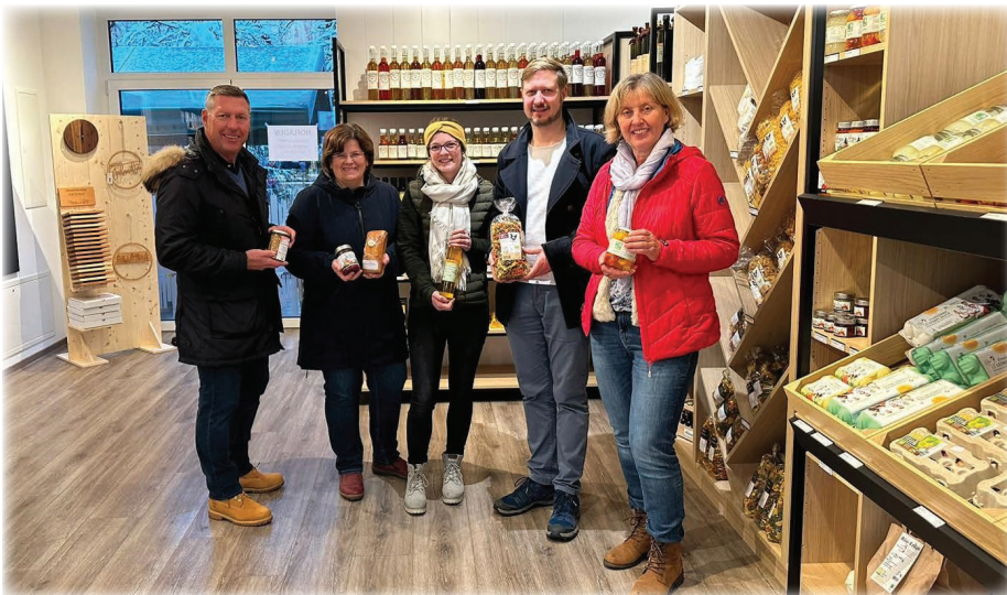
Eröffnung am 02. Dezember 2023 beim Adventmarkt IM HOF.

Ein Einkauf im Hofladen lässt sich auch ideal mit einem Besuch im neuen Lokal "Mercuri's" kombinieren.