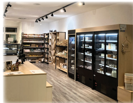
Regionale Vielfalt im Katsdorfer Hofladen.