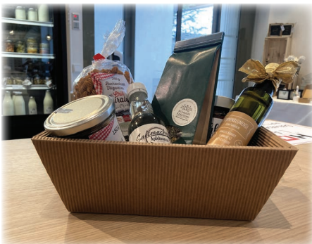
Für ein kleines Mitbringsel stehen auch Geschenkboxen zur individuellen Befüllung zur Verfügung.