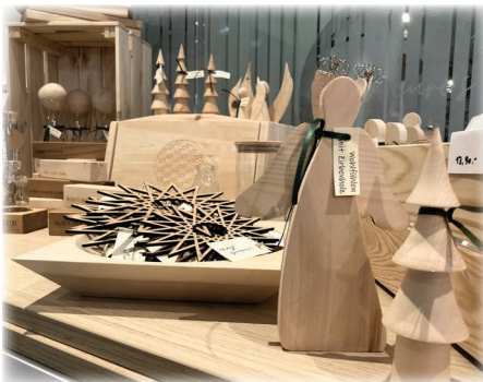
Auch kleine Besonderheiten aus der Umgebung finden ihren Platz im Hofladen.